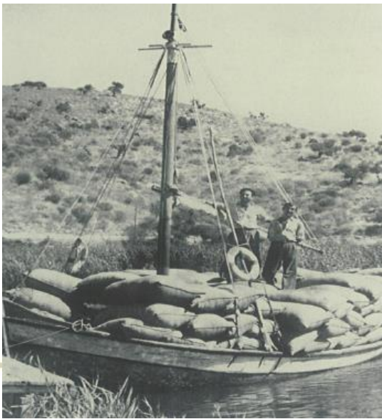
▲ Μεταφορά προϊόντων με πλωτά μέσα