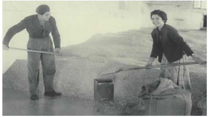
▲ Εργάτες στις αποθήκες του οικισμού