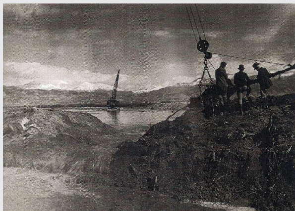
Η αποξήρανση της πεδιάδας της Θεσσαλονίκης

Στην αύξηση της αγροτικής παραγωγής θα συντελέσει και η χρήση νέων καλλιεργητικών μεθόδων και τεχνολογικών μέσων. Την ίδια εποχή ιδρύεται το Υπουργείο Γεωργίας και οι πρώτοι συνεταιρισμοί αγροτών.