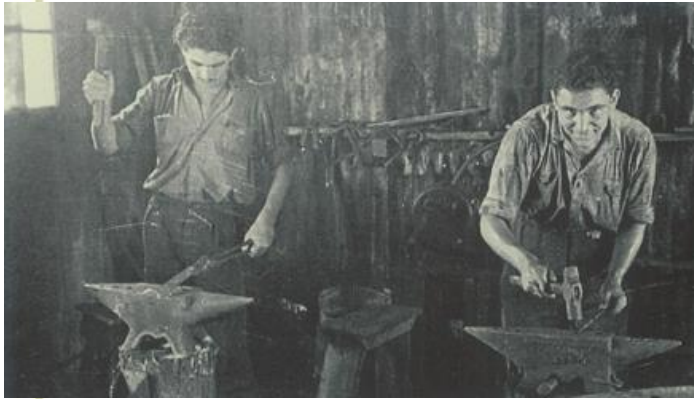
▲ Εργάτες στο σιδηρουργείο