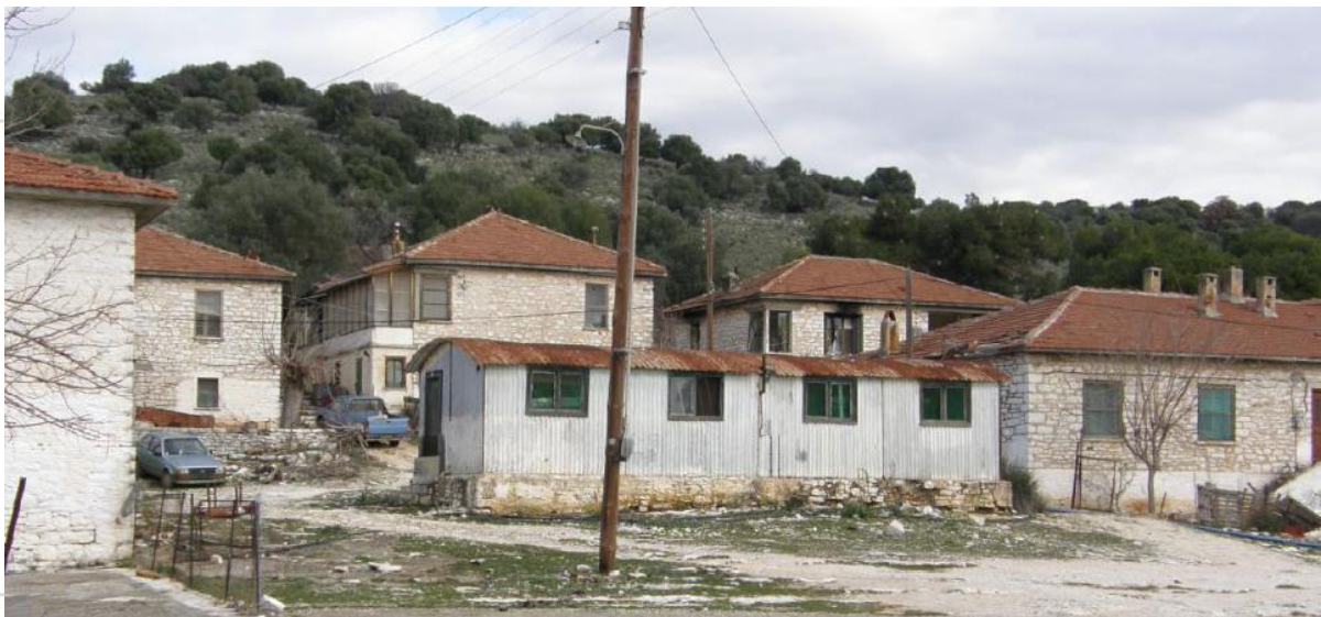
▲ Ο οικισμός στο Βαλτί Ξηρομέρου σήμερα

Κατά τη διάρκεια του Μεσοπολέμου αποξηράνθηκε το έλος Λεσίνοι και δημιουργήθηκε στην περιοχή του Ξηρομέρου ο οικισμός στην περιοχή Βαλτί, ο οποίος άκμασε για αρκετές δεκαετίες.